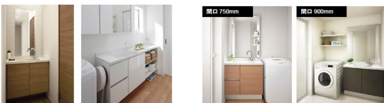
2階の狭小スペースや家事室にも設置可能